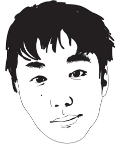
イラスト・柏木翔子

おぎぬまX ギャグマンガ家 最近、カクテルコーヒーにハマってます。(「へえ、おぎぬま、なんかオシャレだなぁ」と思ってくれたら僕の作戦成功です。おいしいよ!)